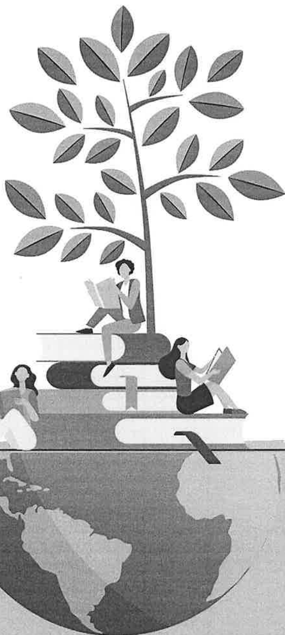
grafico: Liceo Artistico Perugini - Foggia

ex sede IRIP di Foggia - già Deposito Erariale Cavalli Stalloni Via Romolo Caggese, 1